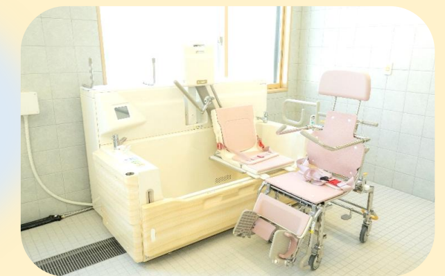
(リフト浴・中間浴)

浴室は、家庭的な雰囲気を大切にして、お一人用の浴槽です。快適に入浴できるよう、介護職員が支援を行います。